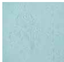
クラシックレースをイメージした花柄。