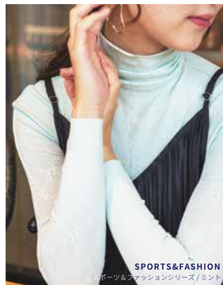
SPORTS&FASHION スポーツ&ファッションシリーズ / ミント