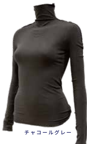
チャコールグレー