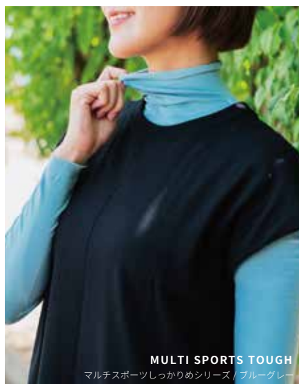
MULTI SPORTS TOUGH マルチスポーツしっかりめシリーズ / ブルーグレー