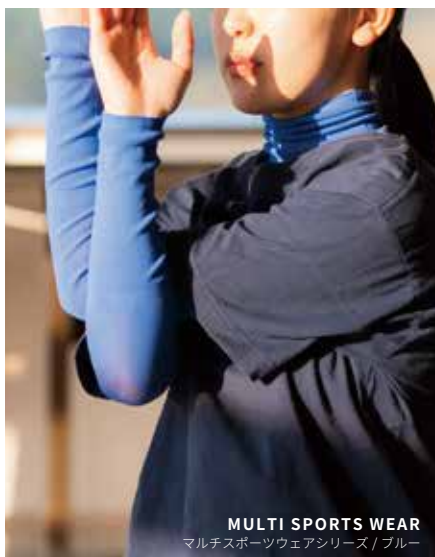
MULTI SPORTS WEAR マルチスポーツウェアシリーズ / ブルー