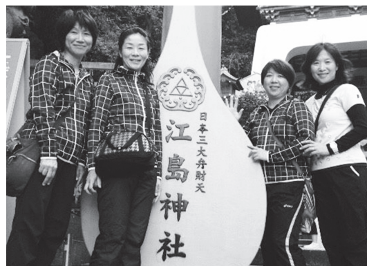
ピンクリボン 優勝者

前回からのペアでの挑戦となった。この一年山あり谷あり。プレイスタイルの違いからか意見の相違もあったり。結局サイドを変える事で合意。さて大会当日。緊張感も気負いもなく淡々と試合が終わっていく。試合中も何を考える事も無く(これを集中というのでしょうか?)あれよと言う間に優勝。終わってからは喜びというより何か開放された感で一杯。自分では感じなかったつもりだけど、やっぱりプレッシャーがあったのかも。これで一つ課題がクリア出来ました。でも実力はまだまだです。これから周りの人の力とペアの力を借りながら、日々精進していきたいです。