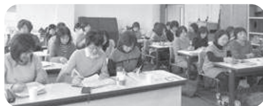
2月12日 第4回拡大委員会の様子(松本市本郷公民館にて)